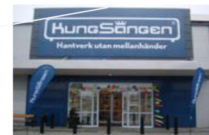
KUNGSÄNGEN Nova Lund, Lund