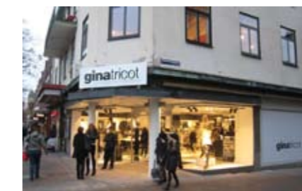
GINA TRICOT Storgatan, Halmstad