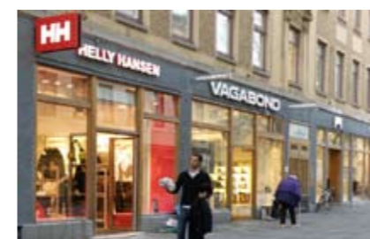
HELLY HANSEN Kungsgatan, Göteborg