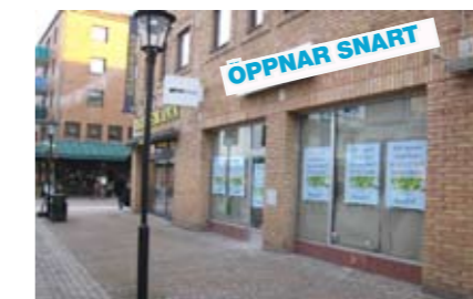
SANDYS Klammerdammsgatan, Halmstad

162 m 2 Förmedlingsuppdrag Öppnar december 2009.