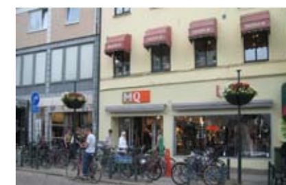
MQ Stora Södergatan, Lund

162 m 2 Förmedlingsuppdrag Öppnar december 2009.