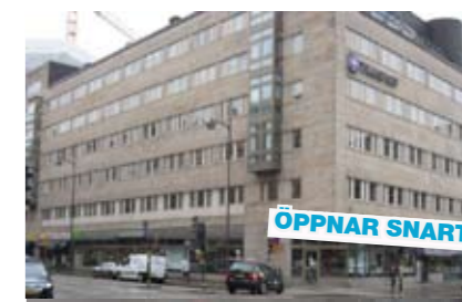
DOCMORRIS APOTEK Vasagatan, Stockholm

125 m 2 Förmedlingsuppdrag Öppnar våren 2010