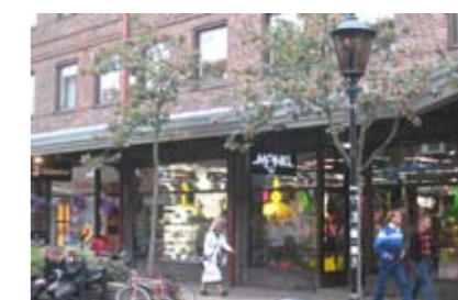
MONKI Köpmanngatan, Halmstad