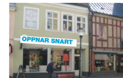
RABALDER Östra Storgatan, Kristianstad

940 m 2 Förmedlingsuppdrag Öppnar januari 2010