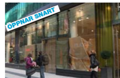
GULDFYND/HALLBERGS GULD Drottninggatan, Stockholm

244 m 2 Förmedlingsuppdrag Öppnar december 2009