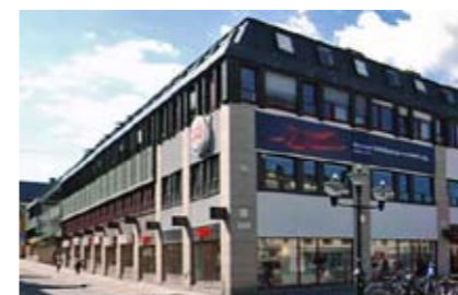
VILLAGE Filbytergallerian, Linköping

240 m 2 Förmedlingsuppdrag Öppnar våren 2010